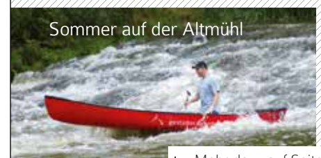
Sommer auf der Altmühl